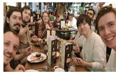
派遣先の同僚との食事風景(グリフィス大学、派遣学生は右から2番目)

▽詳細はウエブサイトを参照 https://www.hiroshima-u.ac.jp/gecbo