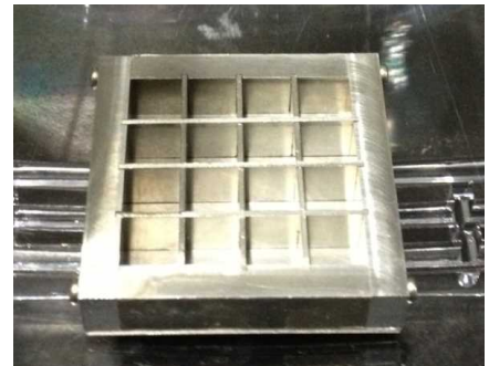
無電力型水素捕集装置の原型

(研究成果) 水素を選択的に透過する膜の作製は、放射線を利用したグラフト重合という方法で行いました。既存の多孔膜に接ぎ木のような鎖(グラフト鎖)を充填した膜について水素と水の透過度について検討した結果、水蒸気分子の溶解度が低下して水素が水蒸気よりも10倍以上高い透過度を示しました。この膜により、高機能マグネシウムが水蒸気による酸化で水素吸蔵性能を損なうことなく周囲の水素濃度を下げることができます。さらに、水素吸蔵量はやや少ないものの、大気中において不活性で取り扱いが容易な過酸化合物と酸化物の水素吸蔵性を調査した結果、銀過酸化合物、酸化物及びニッケル過酸化合物、酸化物は室温から150℃で水素吸蔵材料として安全に利用できることを見出しました。これにより、種々の環境温度に対応する適切な材料を効率的に配置したハイブリッド型複合水素捕集装置を開発できます。さらに、空間における水素の流れを数値シミュレーションで可視化することにより、様々な環境における安全対策としての水素捕集装置を適切に配置した無電力型水素爆発防止システムの構築が可能になりました。