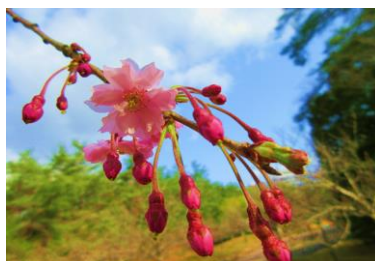
設立10周年記念樹：枝垂れ桜