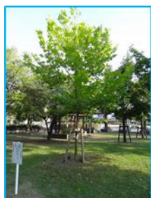
設立記念樹：プラタナスの木