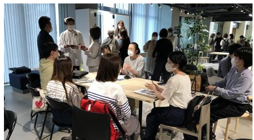
個別に交流・意見交換