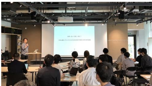
地域の方からのプレゼン