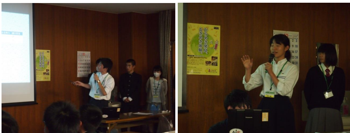
(グループごとの結果発表プレゼン：堂々と発表しました)

一方，TA，とくに SA の学生は「教える」ことの難しさを体感したようです。そして他人に教えることで自分たちが何を知らなかったのかを改めて認識することができたとアンケートにも書いてくれました。