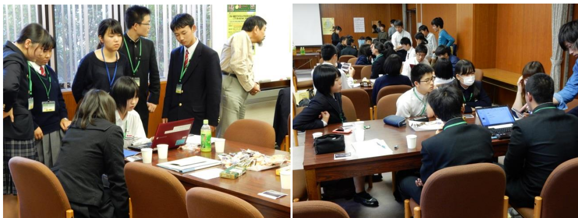
(プレゼン準備：パワーポイントファイルも自分たちで作成)

お菓子のもたらず効果でさらに場は盛り上がり，そのままグループディスカッションに突入。結果をグループごとに Power Point でプレゼンテーションしながら，会場全員で考察・討論し，中には実験の感想や来年への要望などの意見も飛び出しました。うまく結果が得られたグループもあれば，きれいに判定できなかったグループもありました。サイエンスには成功も失敗もあること，そして結果を如何に議論し，次に繋げる何かを見出すことがサイエンスのおもしろさであることも実感できました。