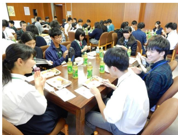
(お弁当タイム：本年も特製にしぼり・ひらめき☆ときめきサイエンスコラボ弁当)