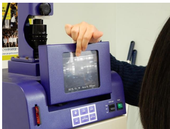
(電気泳動の結果は?)