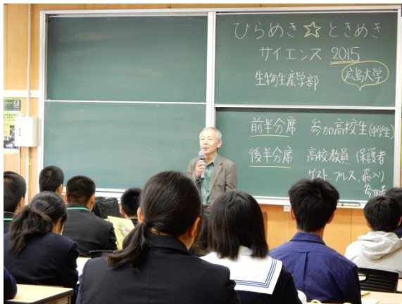
(生物生産学部学部長・植松先生の挨拶)