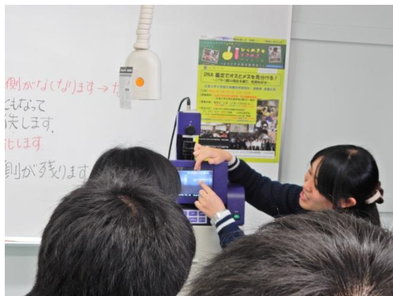
(熱心な説明をする TA)