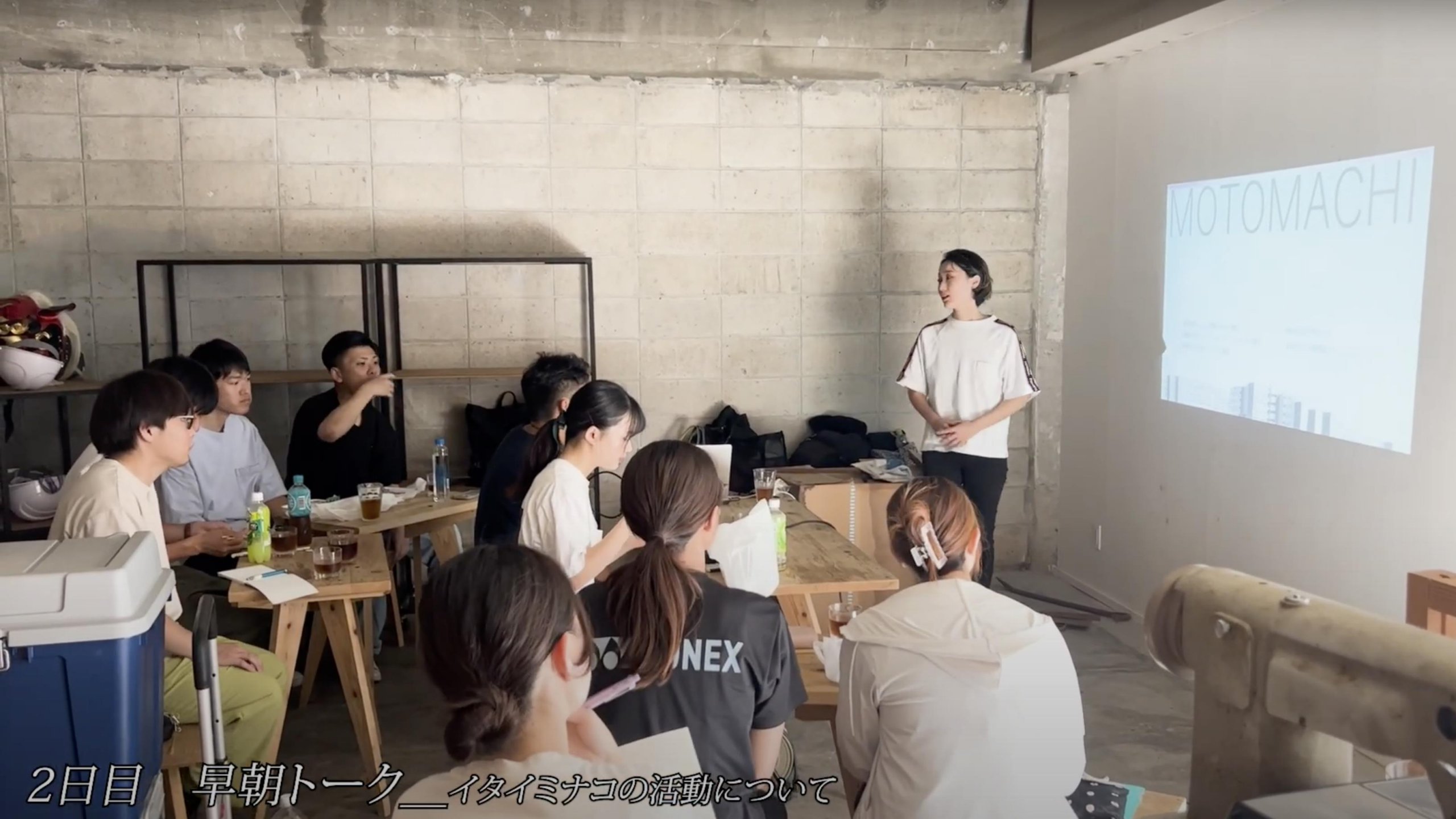
2日目 早朝トーク ― イタイミナコの活動について