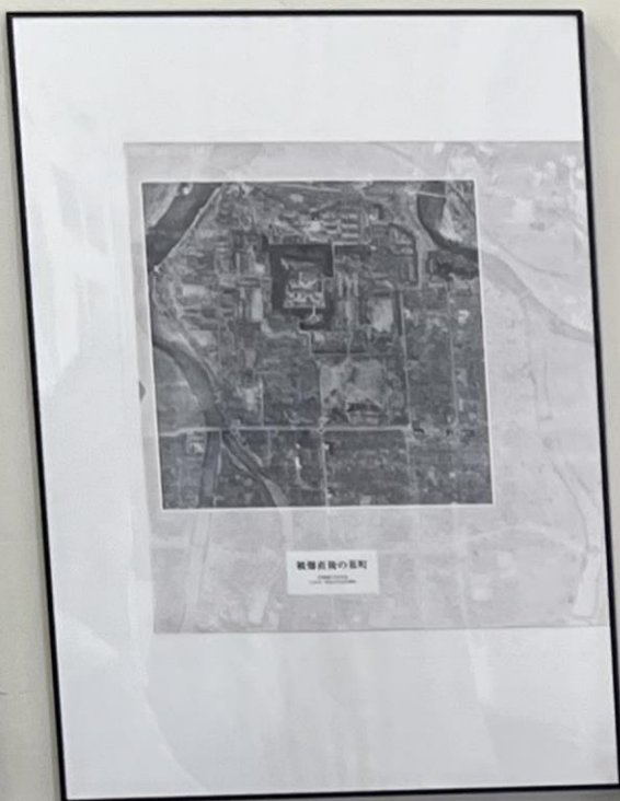
戦災による都市の再開発 広島市は戦災による都市の再開発を進め、戦後の復興を遂げた。この写真は、戦後の広島市を捉えたものである。