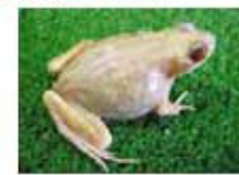
透明カエル「スケルピオン」

・再生研オリジナル「スケルピオン、光るカエル、色変わりのカエル図鑑」プレゼント! (クイズ正解者先着50名様)