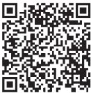
会員用 Web サービス