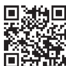
広島大学校友会 入会申込手続き

校友会費は、終身会費 20,000円です。クレジットカード、コンビニ、Pay-easy または払込取扱票でのお手続きが可能です。詳細は Web サイトでご確認ください。