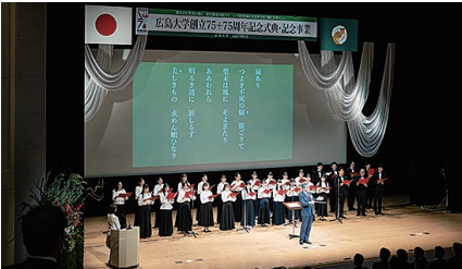
オープニングセレモニー