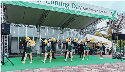
学生ステージ企画