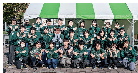
ホームカミングデーの学生スタッフ同で