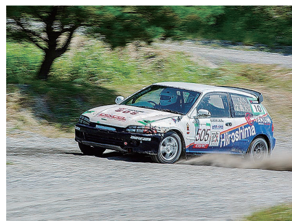
広島大学体育会自動車部 活動テーマ：ジムカーナ、ダートトライアルおよび フィギュアでの全日本大会制覇