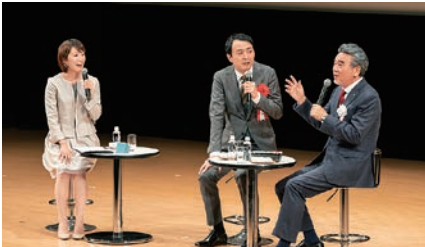
著名人による講演会・トークショー