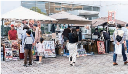
連携市町等の物産展