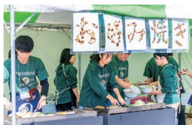
ホームカミングデーの企画・運営