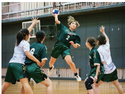
体育会ハンドボール部