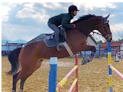
広島大学体育会馬術部 活動テーマ：地域を巻き込んだ循環型農業の実現 ～「優勝堆肥」でリサイクル！～