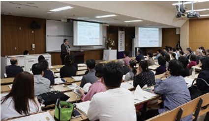
保護者向け地域懇談会