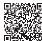
ドリーム チャレンジ賞

学術・文化・スポーツ等における学生の自主的な活動に活動資金を支援しています。これまで計19回実施した結果、683件の提案に対して総額10,461万円を助成しています。公募は年1回行われ、広島大学校友会正会員※3名以上を含む広島大学学生のグループによる取組みであることを応募資格としております。