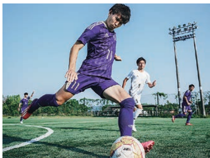
体育会サッカー部