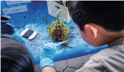
学部・研究科企画（理学部）