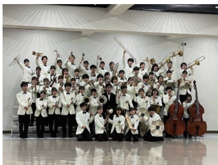
広島大学吹奏楽団 活動テーマ：「楽奏」（がくそう）