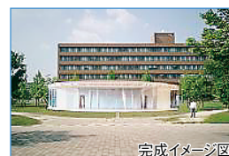
完成イメージ 場所：サタケスクエア(中央図書館前) デザイン：工学研究科 岡河 助教授