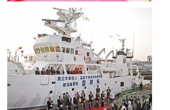
総トン数256トン、全長40.5m。推進システムは全旋回式縦軸型推進機による電気推進