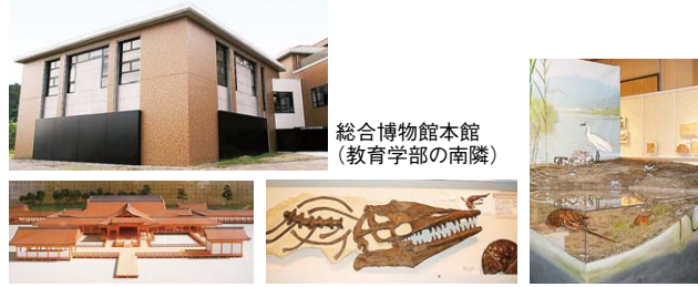
総合博物館本館 (教育学部の南隣)