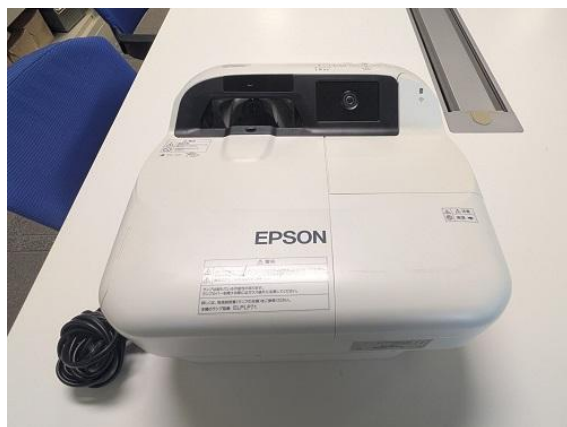
(4) プロジェクター(EPSON EB-1410WT)