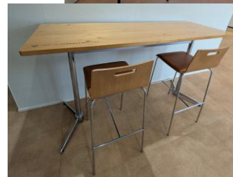
ハイチェア・ハイデスク