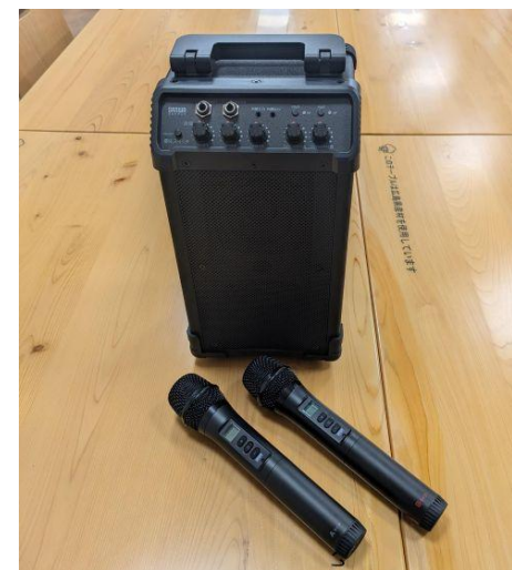
(6) ポータブルスピーカー 1台・ ワイヤレスマイク 2本 (サンワサプライ)