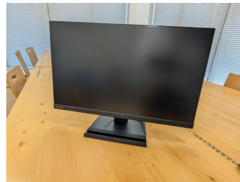
(3) 大型モニター(23.8インチ)