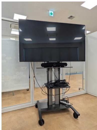
(1) 大型モニター(65インチ)