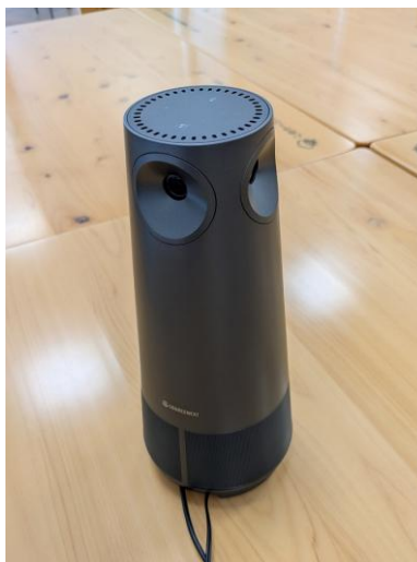
(2) マイクスピーカー・カメラ （一体型）