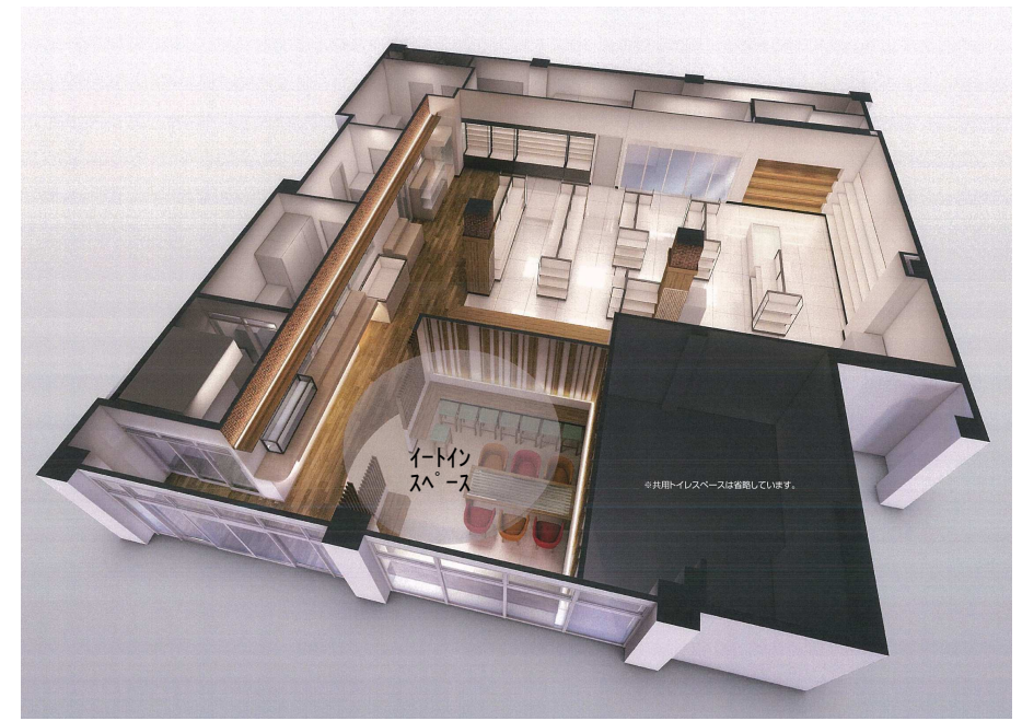
1階 売店 (コンビニエンスストア)