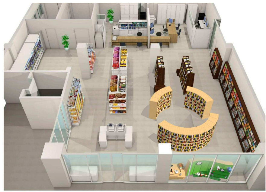
1階 売店 (書籍・文具等)