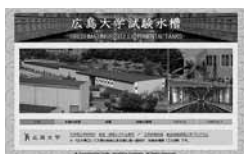
コンテンツ作成・管理 (例: 広島大学試験水槽のWebサイト)