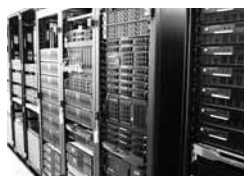
各種サーバ群 (WWW, メール等)