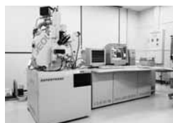
電子プローブ マイクロアナライザ