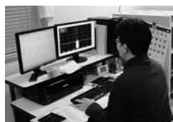
放射性同位元素の 同定作業