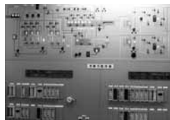
実験排水処理設備