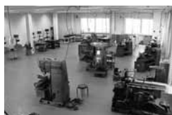
ものづくりプラザ (上: フェニックスファクトリー 下: フェニックス工房)