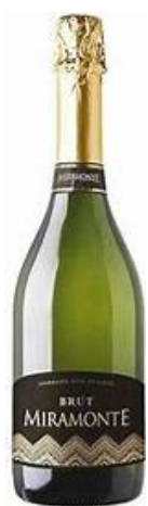
1 アラン・トーマス 2 グランド・ロイヤル 3 プロヴェット 4 ピニョ・レアル 5 ミラモンテ