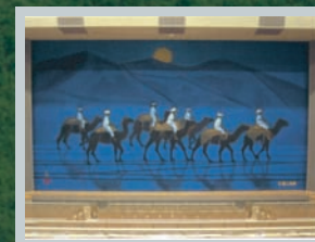
所蔵作品例 平山郁夫「月光流砂らくだ行」