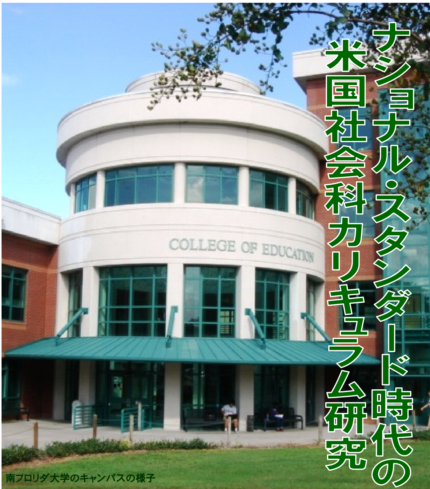
南フロリダ大学のキャンパスの様子