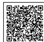
左記(3)掲載 URL 読取コード