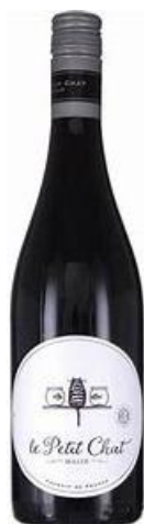
16 レ・プティ・シャ