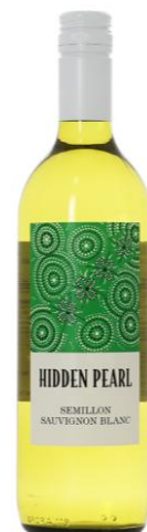
12 ヒドウン・パール