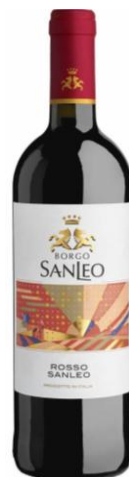
17 ボルゴ・サンレオ