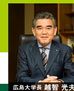
広島大学長 越智 光夫