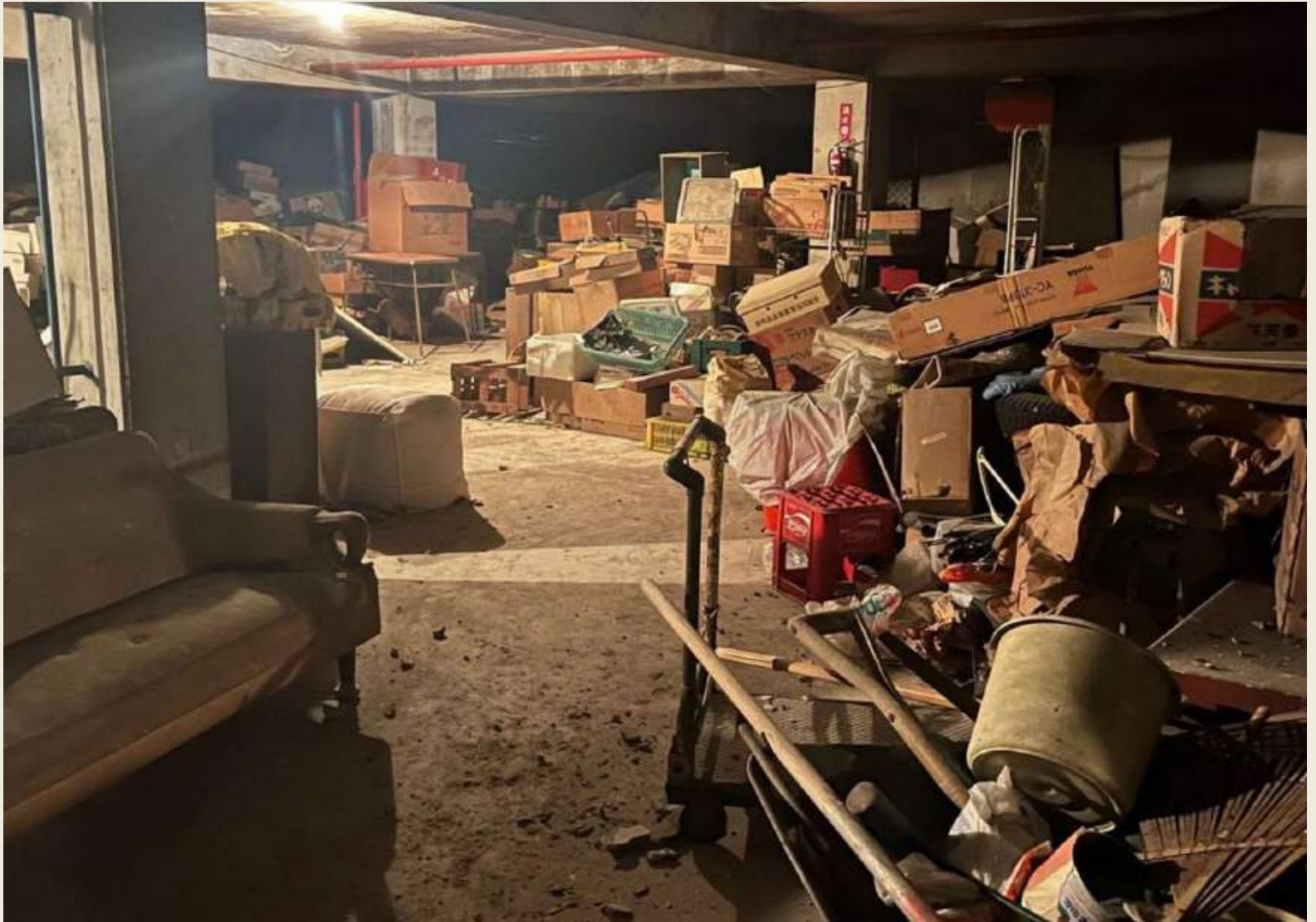
2023年プロジェクト前の地下倉庫