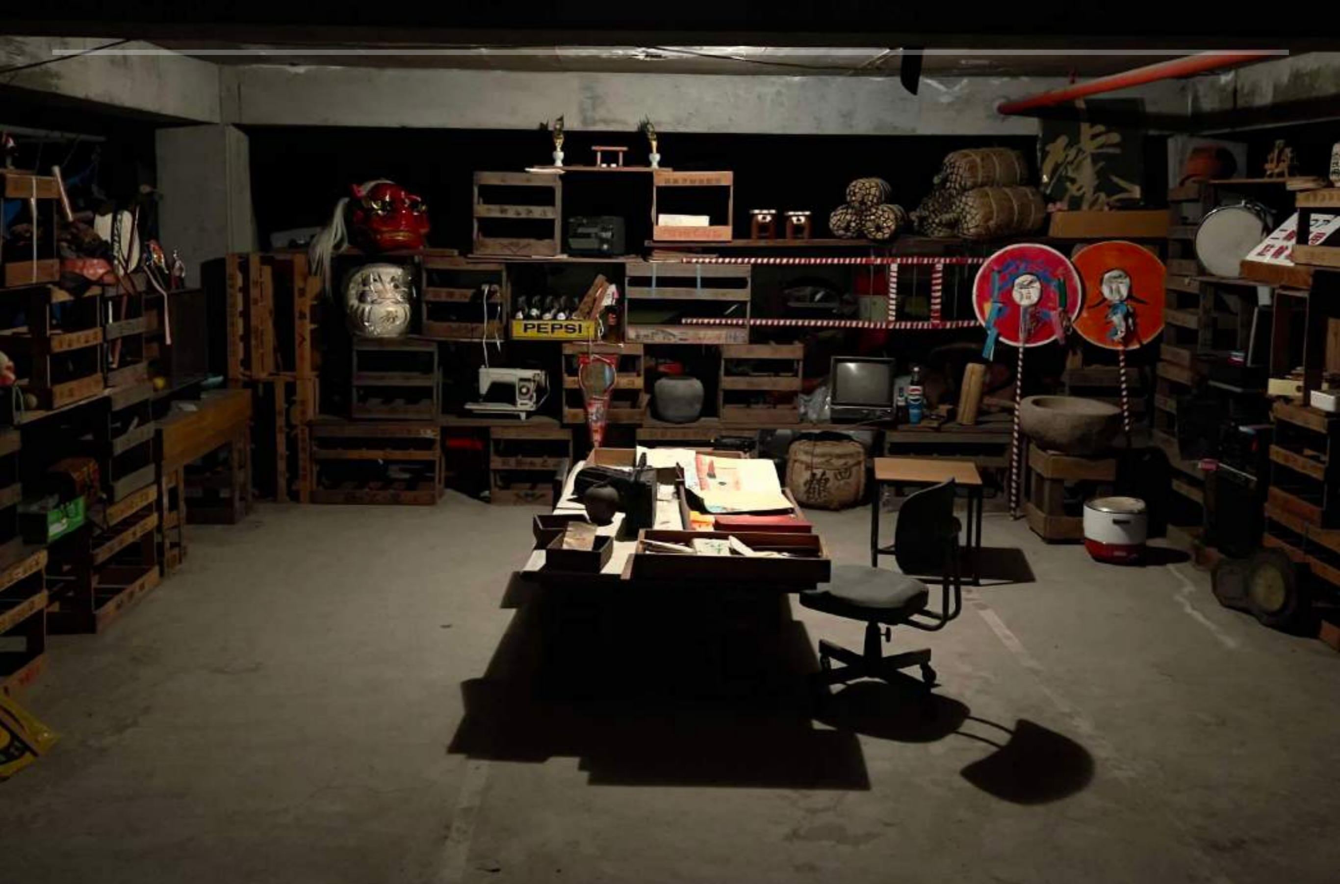
1990年代から放置されていた地下倉庫を資料室へ