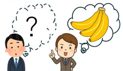
図 1. アファンタジアの人はイメージが浮かびにくい