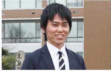
教育実践開発コース 2022年度入学生

私は、学校マネジメントについて学び、新しいものの見方や考え方で自分を省察するとともに、スクールリーダーとしてのぶれない軸をつくりたいと思い入学しました。現在、「主体的に学ぶ児童」が育つカリキュラム・マネジメントに関する研究-学びの深さ(学力・学習の質)に着目して-」をテーマに研究を進めています。ここでは、私が感じている教職大学院の魅力をお伝えします。1つ目は、大学の先生方との議論を交わすセミナーや教育行政・学校管理職実務を学ぶ実地研究です。これらの経験を通して、学校づくりの主体として自覚が高まったことを感じています。2つ目は、様々な立場や考えをもった人たちとの出会いです。そのような人たちとの対話は、自分の頭で考えること・自分の理論をつくることの難しさや楽しさの実感へとつながっています。今後も、学校づくりを通して理論と実践を往還し自分を省察することで、スクールリーダーとしての自分づくりを進めていきたいと思っています。