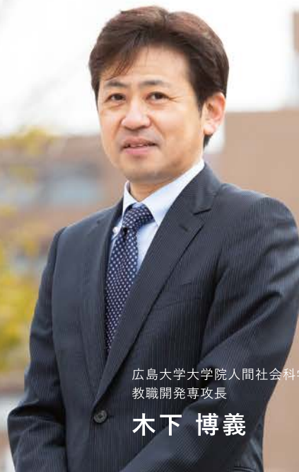
広島大学大学院人間社会科学研究所 教職開発専攻長