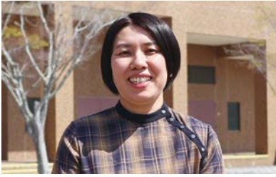
学校マネジメントコース 2022年度入学生