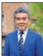
広島大学長 越智光夫