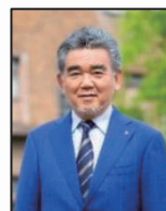
広島大学長 越智光夫