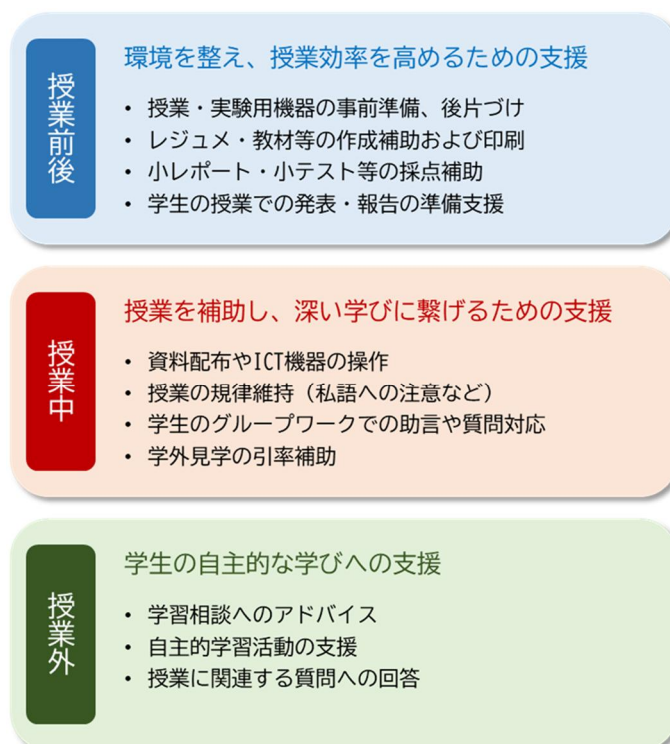
図2 一般的な業務内容

図2では、TA としての一般的な業務内容を整理しています。「授業前後」、「授業中」、「授業外」での活動を確認しておきましょう。