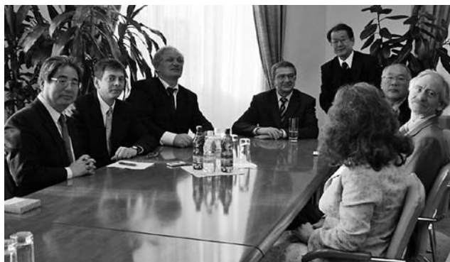
トムスク教育大学との大学間協定国際会議にて（2006年ロシアにて、筆者右から3人目）

最後にこれまでにお世話になりましたIDECの皆様へ深く感謝申し上げますとともに、IDECの今後の発展をお祈りいたします。