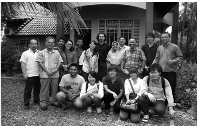
アチェ(インドネシア)短期派遣スタディー・プログラムの参加者(2012年9月)

2. セメスター 1セメスター(6ヶ月)の期間、日本から東南アジアへ、東南アジアから日本へ学生を派遣し、授業を受けます。学生自身によるフィールド調査、あるいは短期インターンシップを行えるようサポートします。IDECでは、2012年9月、シンガポールとフィリピンに各1名ずつ派遣し、またタイから1名の学生を受け入れています。