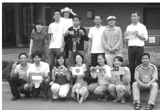
平川ゼミのメンバー

Hirakawa Lab is a large lab with 21 students: nine Japanese and twelve foreign students. Foreign students come from four different countries and seven out of nine Japanese students have experience of doing various activities in developing countries. So, the official language of our lab is English. The mottoes of our lab are "High expectation", "Hard working" and "Helping each other". Having high expectation on ourselves, we are living the days of two Ds: Dream and Deadlines. All students are expected to do field research in their countries or other developing countries, and write a thesis based on the results. In seven years, six Japanese graduates found job in the field of international cooperation. Many foreign students are also doing good job after going back to their countries. The advisor is very proud of the graduates, but some says that she did not do much. All the honorable fruits are born by students' hard work, and the advisor was just pushing them by "provocative" and "stimulus" words.