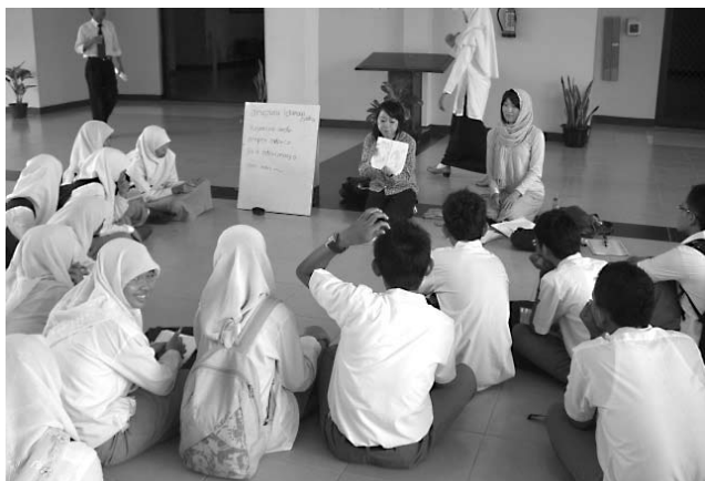
スクマバンサ寄宿学校での教育実習の様子 (インドネシアコース)

IDEC still try to continue and develop this program, an important pillar of IDEC program, for next year as well. I myself try to support effectively for the coming program with my experience in this year.