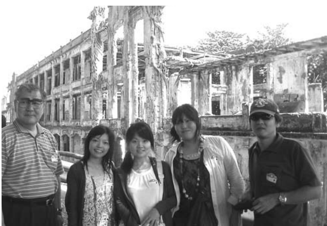
コレヒドール島にて (フィリピンコース)