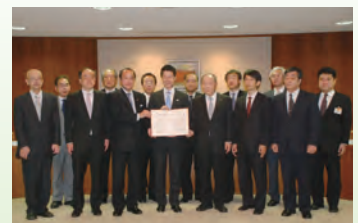
協定書を手に記念撮影する湯崎知事(中央)ら

4病院は高精度放射線治療装置3台(リニアック)を共同利用するほか、治療面での連携や人材育成に取り組めます。