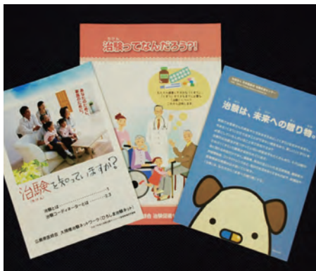
治験についてのパンフレット

新しい薬を使えるチャンスがありますし、より詳しい診察や検査を専門医から受けられます。その一方で、知られていなかったような副作用がまれに出る可能性もあります。同じ病気を持つ人の将来の治療に役立つことを、ぜひともご理解いただければと願っています。