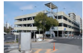
新しくできたP1駐車場