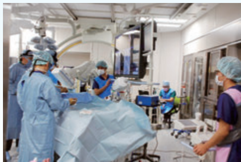
ステントグラフト治療