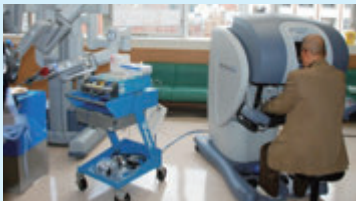
手術ロボットを遠隔操作