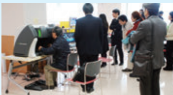
シミュレーター体験の様子を見る参加者