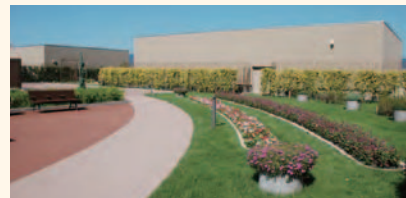
草花が彩る屋上庭園

☎ 初診の方や予約のない方は1階中央受付の「初診」窓口・「再診」窓口にご提示ください。