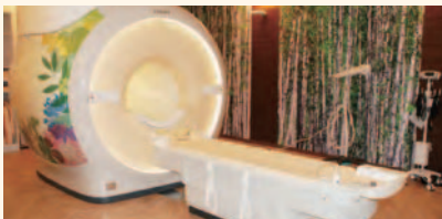
森をイメージしたMR室(B1F)

患者さんのプライバシーを重視して医科の診察室は個室に、歯科もチェアごとに仕切りを設けています。2カ所の「光庭」から自然の光を建物内に導きます。約40種の植物が彩る屋上庭園には遊歩道やベンチを設置。東西の壁面にも常緑つる性樹木のヘデラ(アイビー)を配し、省エネルギーと癒やしの空間づくりに一役買っています。