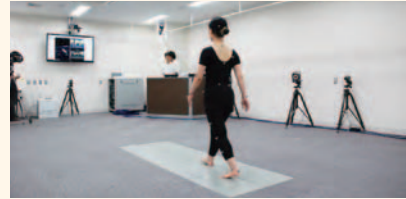
スポーツ医科学センター(5F)