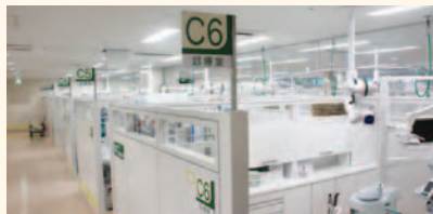
歯科診療室にも間仕切り(3F)