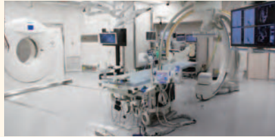
緊急手術も可能な血管造影室(4F)