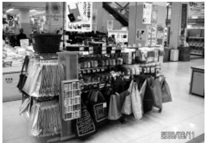
レジを出たら目に付く、色とりどりのエコバッグ。

余談になりますが、当店では、食品コーナーのお客様の四〇％くらいが広大生の方です。ですから、仮にそのうちの半分に買い物袋を持参していただければ、それだけでも割合がグンと上がるんですけどね（笑）。