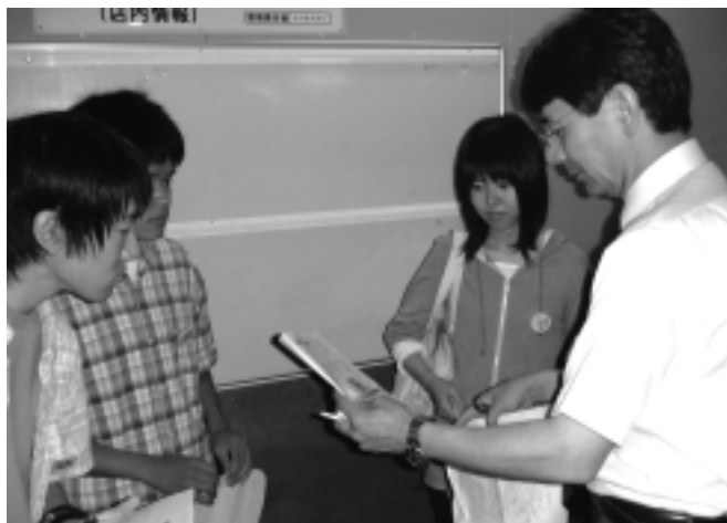
お忙しい中、ご協力ありがとうございました。

http://www.aiwanet.com/uniform/index.html