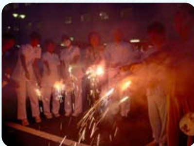
職員と花火を楽しむ患者さん