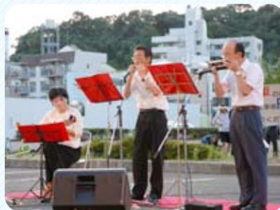
トリオエコーズによる演奏

平成21年8月4日、広島大学病院北駐車場にて病院職員の手づくりによる花火まつりを開催しました。