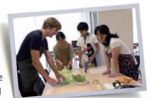
Regional World Cooking