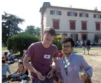
トゥールーズ・ルミライユ大学

本学に在学しながら、海外協定大学に正規交換留学生として在籍します。留学先の取得単位は帰国後、本学で履修した単位として認定し、留学期間を含め4年間の卒業を目指します(一部認定外の単位あり)。留学中の授業料は本学に納めるため、特に英語圏の大学への私費留学よりも経済的です。