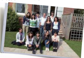
エクセターアカデミー

さまざまな国籍の学生で構成されたクラスで学ぶ語学研修プログラムです。滞在期間中はホームステイを経験します。