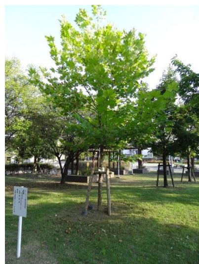
記念樹 プラタナスの木

URL: http://www.hiroshima-u.ac.jp/kansai-fc/2