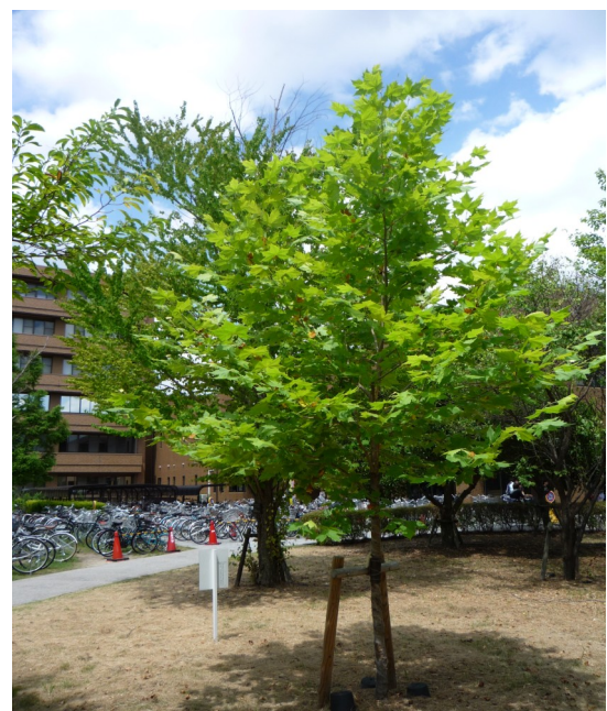
プラタナス(関西フェニックスの会寄贈木)は元気です(後方は法・経済学部)