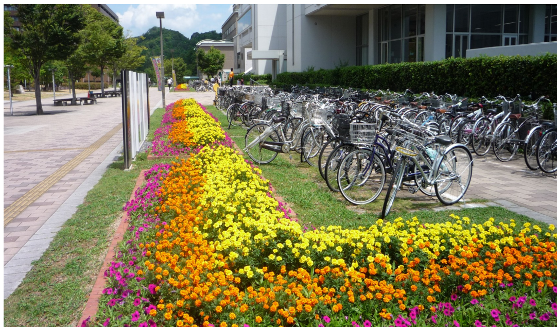
中央図書館前の花壇(学生の姿が見えないのは、試験期間中のため)

年に1度皆様とお会いできる機会です。ぜひぜひご出席ください。役員の方はお早めにメインサロンにご集合ください(11時30分から役員会を行います)。