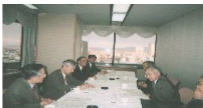
平成12年2月29日開催「第1回発起人会」

平成11年の夏より、卒業生にお願いする就職支援活動の形態を種々検討し、平成12年2月29日に、広島大学関西地区就職応援団を発足させるための会合が開催され、具体的な活動がスタートしました。