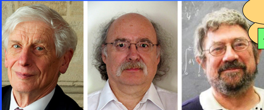
サウレス博士 ハルゲイン博士 コスタリッツ博士