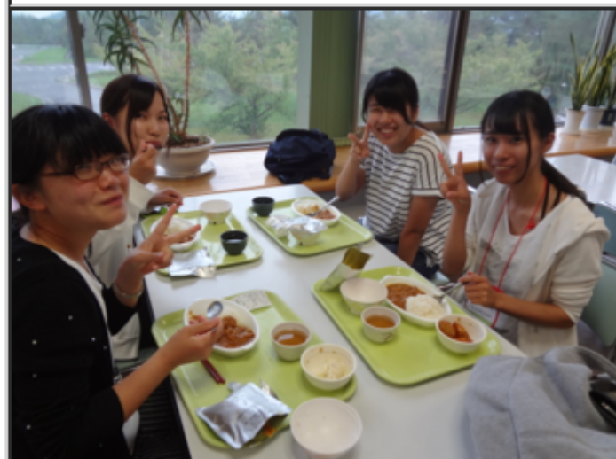
実習で作ったレトルトカレーの試食