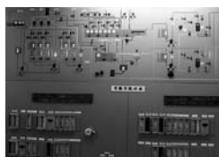
実験排水処理設備