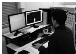
放射性同位元素の 同定作業