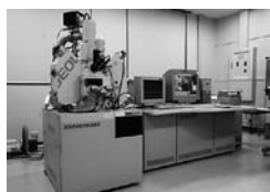
電子プローブ マイクロアナライザ