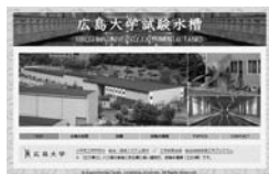
コンテンツ作成・管理 (例: 広島大学試験水槽のWebサイト)