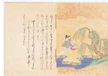
(奈良絵本「伊勢物語」)