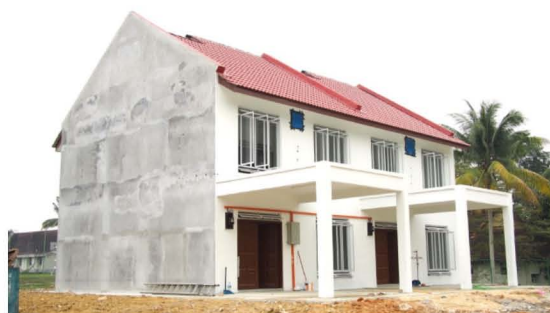
省エネ化手法検討用に建設された実験住宅