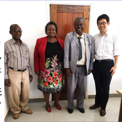
イリンガ州行政長官表敬訪問にて

今の仕事はG.ecboプログラムでの経験がそのまま仕事に生きています。特にプロジェクトと一緒に運営する相手国政府の行政官(カウンターパートと呼んでいます)との関係構築、日本人専門家チーム内での仕事の進め方は自分の中に根付いています。例えば、カウンターパートと仲良くなる方法。チームが必要としていること・情報にアンテナを張り、いつでもチームのために動けるように備えること。また、日本とは異なる生活環境下に身を置くときの健康な心身の保ち方などです。これらのノウハウは体験によって磨かれますので、インターンで場数を踏めたことは私の財産です。