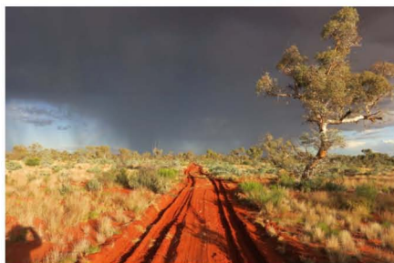
西豪州の探鉱現場の様子

G.ecboのインターンシップでは、研究対象としていた鉱床に関する知見を深めることができたのはもちろん、渡航前のカウンターパートとのメールのやり取りや、現地の研究者とフィールドで岩石を見ながら議論するなど、貴重な経験をすることができました。それらは海外出張時や海外からの来客への対応の際に活かせていると感じます。