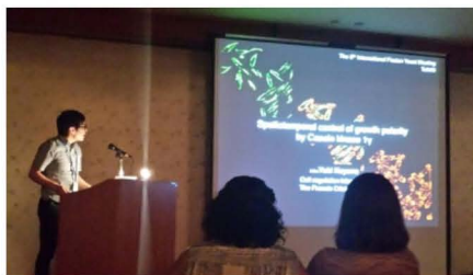
国際学会での発表の様子

最後に、海外留学をするかどうかで悩んでいる人がいれば、ぜひ挑戦してみることをお勧めします。日本の科学技術が進歩し、インターネットを利用すれば世界中と繋がることができる現在において、留学の必要性は少ないかも知れませんが、人生の転機となる経験や出会いに遭遇するチャンスは多くなるし、自分では気づかないところで必ず成長できると思いますよ。