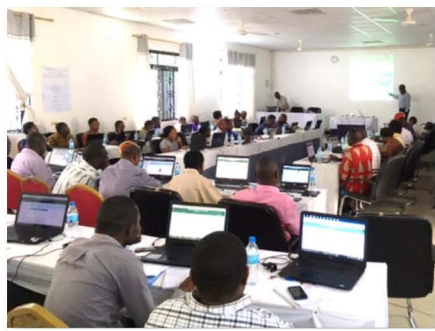
州・県担当官向け全国研修の様子

G.ecboプログラムは、貴重な体験ができる画期的なプログラムだと思います。積極的に挑戦し、学術研究や卒業後のライフデザインに役立ててください。