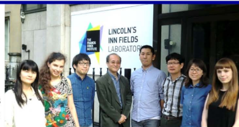
留学中のラボメンバーとの集合写真 (前列左から三人目が筆者)

2013年3月に博士課程後期を修了し、その後、英国癌研究所(現The Francis Crick Institute)へポスドクとして留学。2015年10月から岡山にある重井医学研究所でテニュア研究員として「腎臓病」をテーマに日夜研究に励んでいます。