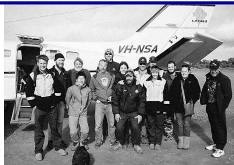
西豪州の探鉱現場への通勤に使う小型機にて (前列左から二人目が筆者)

現在、鹿児島県の北部にある菱刈鉱山で金(gold)を探す仕事をしています。年に2~3ヶ月程度、オーストラリアやアラスカの探鉱現場(砂漠)・操業鉱山へ出張し、現地の地質技術者に混じって探鉱活動を行っています。今年の4月からは、オーストラリアの銅鉱山へ駐在し、現地の地質技術者と共に、鉱山を延命させるべく鉱山周辺での探鉱業務に従事します。