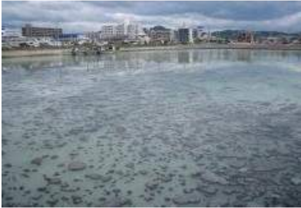
福山内港における2010年5月のスカムの大量発生状況