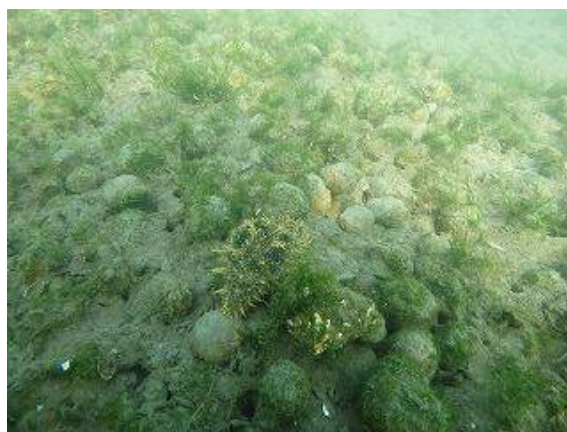
観察されたアオノリとアメフラシ (2016年12月)

(底質改善を実施した2014年10月以降改善している。臭気指数10は環境基準値の最低値。)