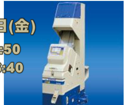
農家用小型光選別機「ピカ選」