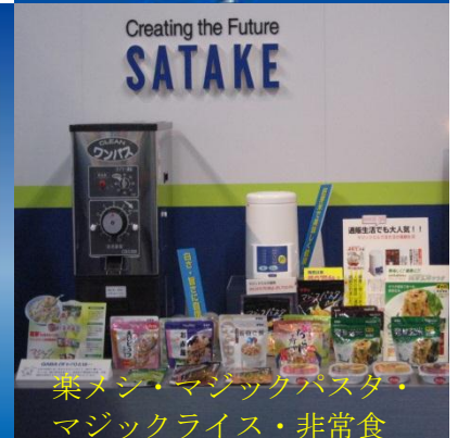
楽メン・マジックパスタ・マジックライス・非常食