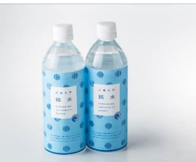
ボトルウォーター (広島大学銘水)