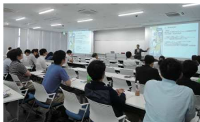
54人出席のもと、白熱した議論が行われた

て、交通の時間価値の計測方法を再構築する。この手法を3つの事例研究へ適用し、質の高い交通時代の道路事業の包括的評価手法の有用性に