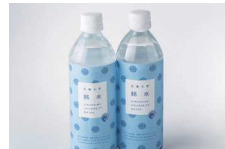
ボトルウォーター(広島大学銘水) 100円