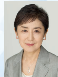
くにや ひろこ 国谷 裕子氏 東京芸術大学 理事 慶応義塾大学 特別招聘教授 FAO(国連・食糧農業機関) 親善大使(日本担当)