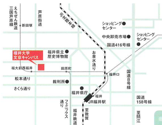
文京キャンパス内マップ

〒910-8507 福井市文京3-9-1 TEL/FAX: (0776) 27-9858 E-mail: danjyo@ml.cii.u-fukui.ac.jp