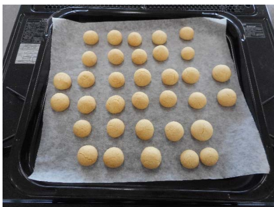
↑部活で作ったスノーボールクッキー

文化祭ではクッキーや焼きチョコを作り、高校調理同好会の先輩方と一緒にお菓子販売も行っています。