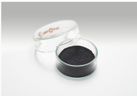
リチウムイオン電池正極材料