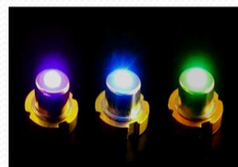
レーザーダイオード

【本社所在地】 徳島県阿南市上中町岡491番地 【資本金】 467億4,144万1千円 【従業員数】 グループ合計 8,300名(平成24年10月現在) 【事業内容】 蛍光体(CRT用、蛍光灯用、PDP用、X線増感紙用)、発光ダイオード“LED”、レーザーダイオード、光半導体材料、ファインケミカル(電子材料、医薬品原料、食品添加物)、遷移金属触媒、真空蒸着材料、電池材料、磁性材料の製造・販売