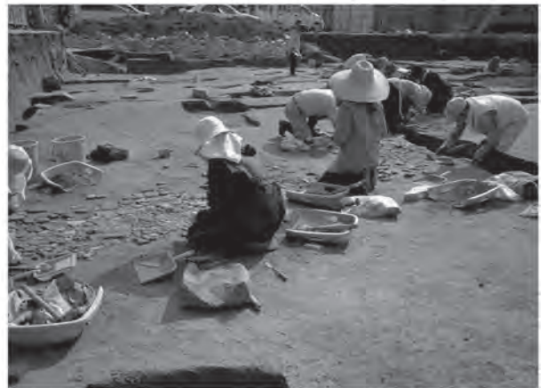
広島城跡発掘調査の様子