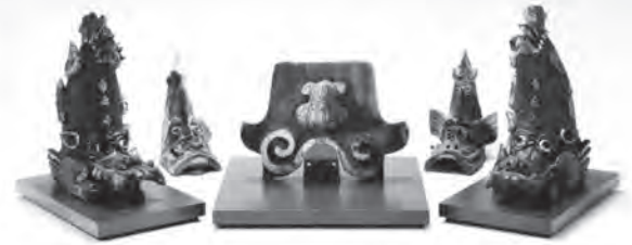
広島城跡出土金箔瓦