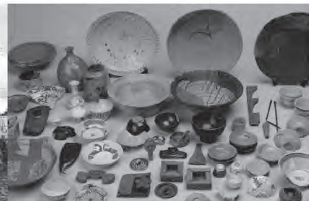
松江城下町遺跡出土遺物