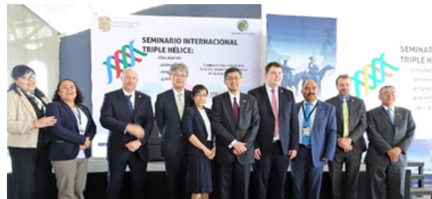
8カ国から集まった講師陣

授らが、産学官連携に対する取り組みを事例を交えて紹介した。 各国の大学の国際産学連携の担当者が一堂に会える貴重な機会となり、参加者を核にネットワークを広げていくことを確認し終了した。